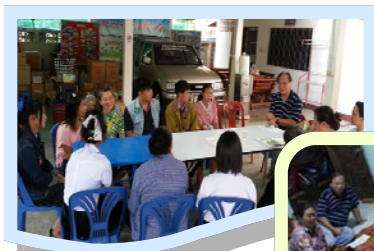
บ้านเมตตาธรรม ต.แม่กา และ กลุ่มแทนความห่วงใย ต.บ้านด้า อ.เมือง จ.พะเยา